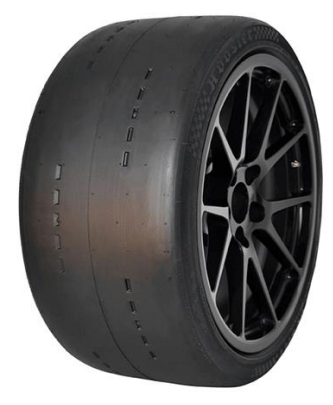
Hoosier A7 & R7 & H7