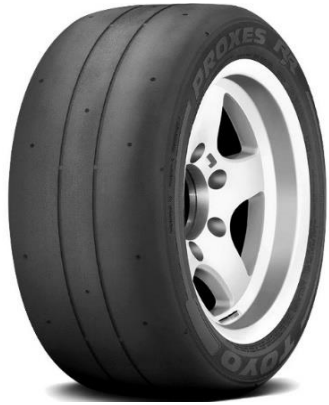
TOYO PROXES RR