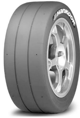
HANKOOK VENTUS Z214