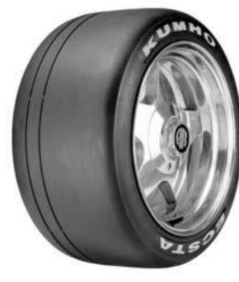
KUMHO ECSTA V710